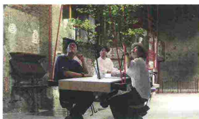
Il Balanco table, un tavolo che ondeggia esposto alla Fonderia.

Dall'alto, in senso orario: la designer Patricia Urquiola, l'architetto Piero Lissoni, la stilista Angela Missoni, lo chef Davide Oldani. Sono alcuni dei protagonisti della F Design Week , in scena alla Galleria Robertaebasta, in via Fiori Chiari 3 a Milano.