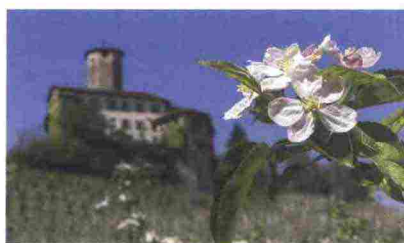
La fioritura di un melo in Val di Non, in Trentino.