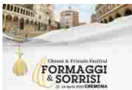
Formaggi e Sorrisi a Cremona

Convegni, disfide, show cooking con Tessa Gelisio, degustazioni, spettacoli itineranti e d'animazione, e l'Oscar del Formaggio ad Edoardo Raspelli