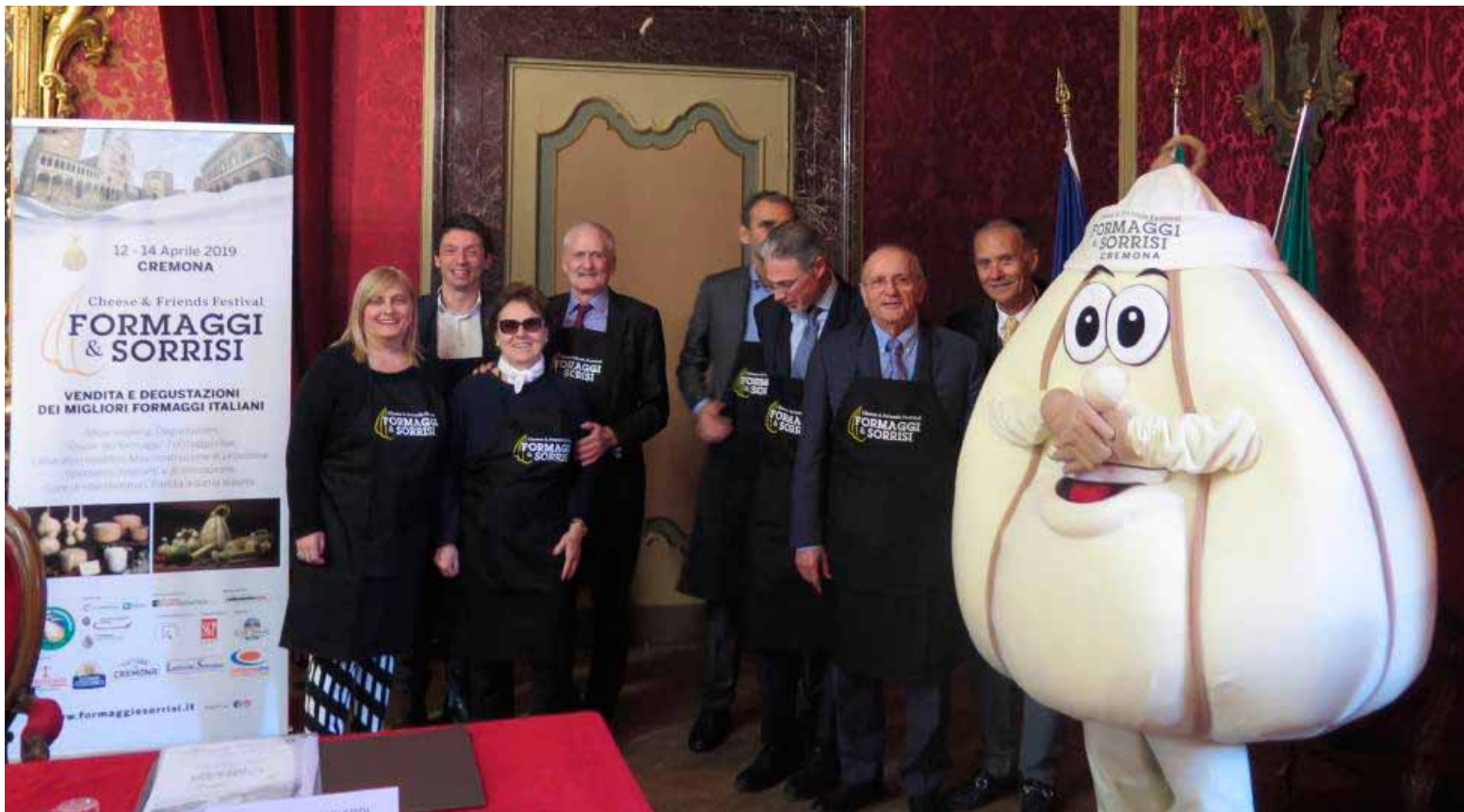
Autorità e sponsor della festa Formaggi & Sorrisi Cheese & Friends Festival presentata ieri in sala giunta di palazzo comunale